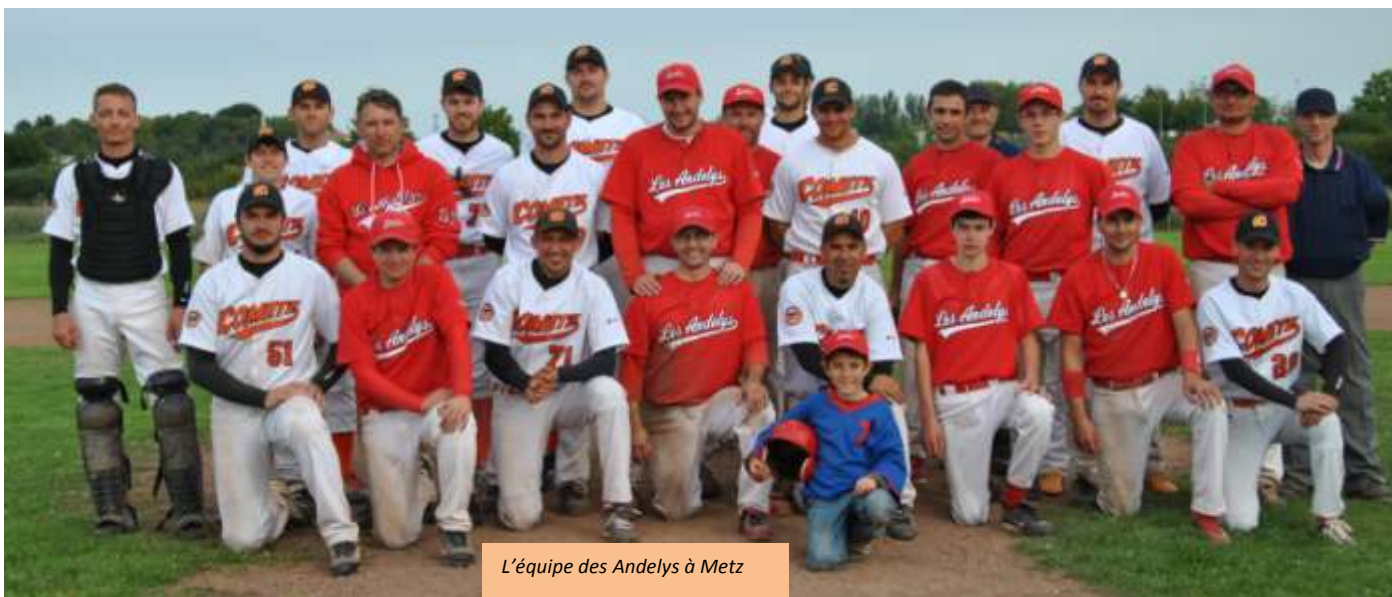
L'équipe des Andelys à Metz

A l'issue de la poule de championnat Normandie, l'équipe junior senior était une nouvelle fois qualifiée pour la N.2. Ce championnat comprend 4 poules de 4 équipes chacune, suivies pour les 2 premiers de chaque poule des play-offs, puis des finales nationales.