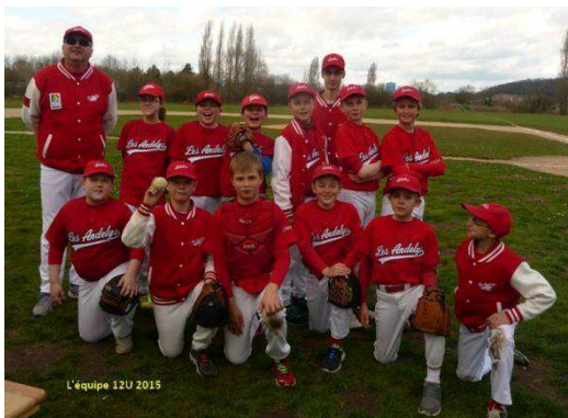
L'équipe 12U 2015

Des membres du club ont participé activement le Samedi 30 Mai en bord de Seine à cette journée. De nombreux jeunes, et quelques adultes, sont venus taper la balle dans le tunnel de frappe qui était installé, et se renseigner sur le club. Alors, bientôt au club ? Nous espérons, il faut des nouveaux pour continuer les équipes jeunes.