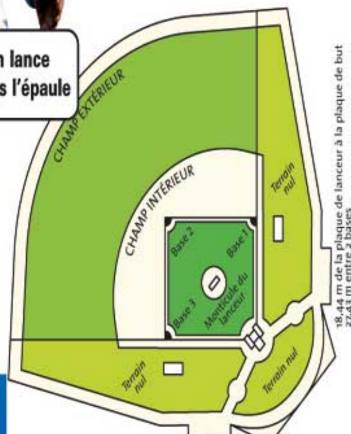
18,44 m de la plaque de lanceur à la plaque de but 27,43 m entre 2 bases

Au baseball, on lance la balle par dessus l'épaule